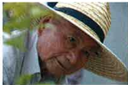
植樹祭監修・指導