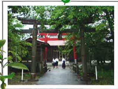
震災前の八重垣神社