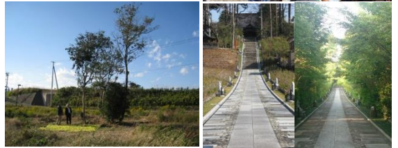
津波に耐えたヤブツバキ 植樹Before⇒After